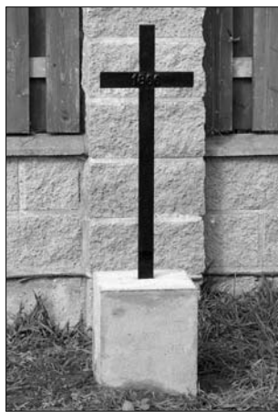
Nově zřízený kříž v Holíně 13. 4. 2016