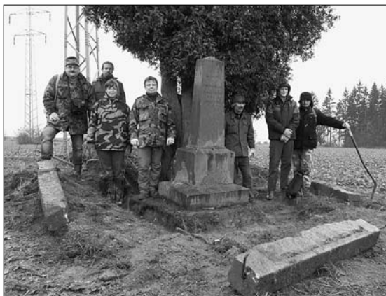
Členové Komitétu 1866 a SPVH-Náchod u památky ev. č. 85 během podzimní brigády

Aktivity na bojišti ve výročním roce symbolicky ukončil 19. listopad podzimní brigádou členů Komitétu 1866 a SPVH-Náchod 2) . Bojovníci z řad 6. praporu polních myslivců z Náchoda opět prokázali svůj zápal pro věc. Tak jak čelili příslušníci tohoto praporu před 150 lety dešti střel nedaleko Vysokova, tak neohroženě si počínali i členové SPVH při souboji s deštěm podzimním. Hlavní důraz byl kladen na úpravu okolního terénu u pomníku na hrobě setníků Ludvíka Koprivy a Aloise rytíře Stránského rakouského