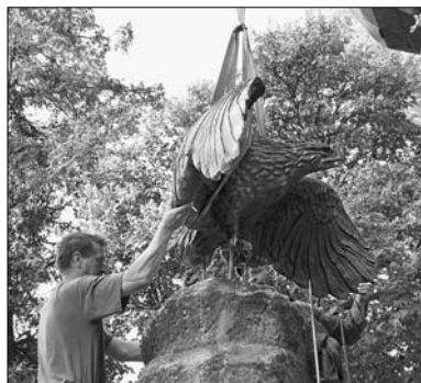
Osazování repliky plastiky moravské orlice