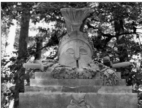
Prachov – detaily rukojetí mečů 23. 6. 2016

Na závěr bych chtěl poděkovat všem, kteří pečují a starají se o památky z války 1866, čímž zanechávají odkaz pro budoucí generace.