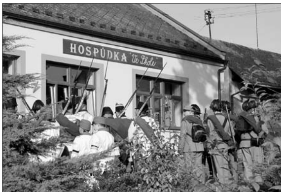
Řazení uniformovaných účastníků akce v Bosni 15. 10. 2016

V pondělí 7. listopadu v Klášteře Hradiště nad Jizerou byla vybetonováním