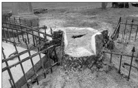
Likvidace zbytků jasanu u Dlouhých Dvorů 8. – 9. 4. 2016

zemědělského družstva zapůjčena formou sponzorského daru, pracovníci vykonali dílo za dřevo. Nutno ještě říci, že práce byly provedeny vysoce profesionálním způsobem a pomníky nebyly při manipulaci s kmeny poškozeny.