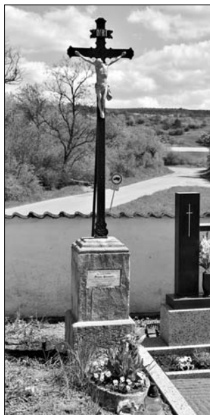
Opravený kříž v Doubravici nad Svitavou 29. 4. 2016

základu zahájena počáteční etapa obnovy zaniklého pomníku 1 rakouského vojáka padlého 28. června 1866. Instalace samotného pomníku během odpoledních hodin posledního dne měsíce listopadu znamenala pro mnichovohradištské bojiště rozšíření počtu evidovaných památek na číslo 60. Uvedená