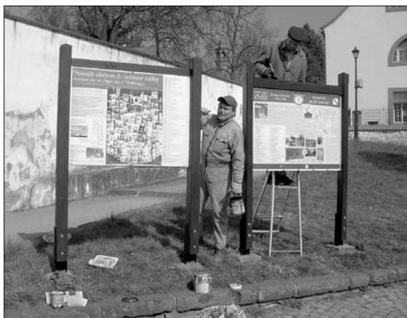
Nátěr stojanů v Mimoni 27. 3. 2016

Rok 2016 znamenal významné výročí vztahující se k historii léta roku 1866 a s tím související vzpomínkové kulturně-společenské akce naplánované s příslušnými samosprávami v regionu severních Čech. K tomuto výročí s některými bylo navíc ještě jednáno o obnově zcela zaniklých pomníků. Jelikož v kalendáři akcí zpracovaném v předcházejícím roce Komitétem 1866 ke 150. výročí války roku 1866 byly severní Čechy zahrnuty na prvních místech, proběhlo již v lednu 2016 několik jednání na Obecním úřadě Dlouhý Most, Městském úřadě Ralsko a Městském úřadě Mnichovo Hradiště. Jejich cílem se stalo nejen odsouhlasení časové posloupnosti jednotlivých bodů programu, ale rovněž zajištění všeho potřebného pro stanovený počet uniformovaných účastníků a dále i opatření souvisejících s případným doprovodným programem, pokud byl dříve dohodnutý mezi oběma stranami. Jako určitý odpočinek v časově náročných jednáních se stala sobota 20. února, kdy se v Křížanech uskutečnil pietní akt k uctění zemřelého vojáka Napoleonovy armády z roku 1813, pořádaný Spolkem vojenské historie Liberec o.s. Během této akce byli přítomni pozvání technickým referentem Komitétu 1866 pro oblast severních Čech na jednu z dubnových sobot do Dlouhého Mostu a na přelomový víkend dubna a května do Kuřívod a Mnichova Hradiště. Rovněž křížanecká akce umožnila další pozvánku, tentokrát do Severočeského muzea v Liberci, kdy na kalendářní období od konce června do konce září byla naplánovaná výstava Prusko-rakouská válka 1866.