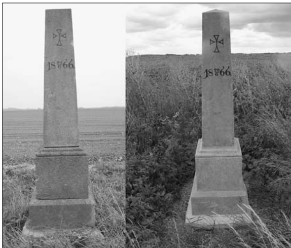
Pomník rakouského pěšího pluku č. 37 u Dolan (ev. č. 17) před a po opravě

18. června pořádala obec Dolany akci Dolany v Dolanech. Součástí programu byla připomínka bitvy u nedalekých Svinišťan. Obec v roce 2016 poskytla částku 20.000 Kč na opravu pomníku e. č. 17. zrestaurovaného P. Szabovou krátce před výročí bitvy.