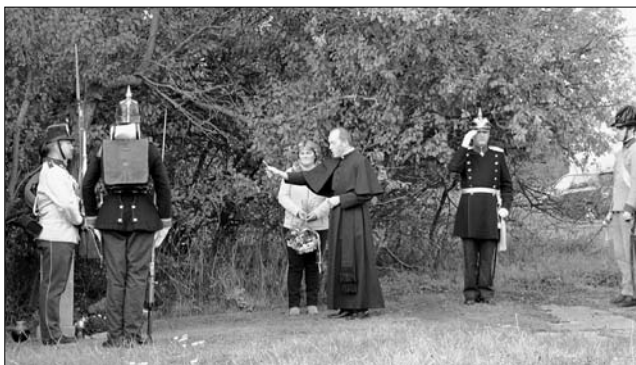
Vysvěcení pomníku v Bosni 15. 10. 2016

obnova se tak stala poslední fyzickou činností na závěr úspěšné sezóny jubilejního roku 2016.