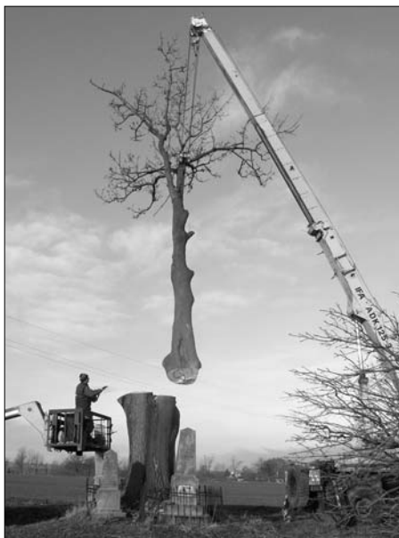
Kácení jasanu u Dlouhých Dvorů 31. 1. 2016

Královéhradeckého kraje. Ostatky byly předány odborníkům z Kriminálního ústavu Policie České republiky v Praze k provedení odborné antropologické expertízy. V ossariu bylo též nalezeno několik artefaktů jako například knoflíky, přezky, podkúvky z bot, rakouský orel z čáka a další kovové součástky výstroje. Jako zvláštnost se našla také poměrně dobře zachovaná kožená peněženka. Tyto nálezy se stanou po odborném zpracování a nakonzervování součástí sbírek Muzea východních Čech v Hradci Králové. V měsících červenec až říjen proběhla vlastní oprava ossaria, kterou provedla firma Novotných.