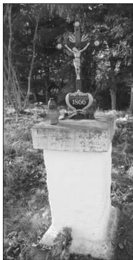
Lužná u Rakovníka – současná podoba