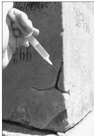
Zpevňování kamene při restaurování pomníku ev. č. 17 u Dolan

27. června se konala mše za padlé vojáky v kostele Nanebevzetí Panny Marie v Malé Skalici. Pro zájemce jsem poté uspořádal malou komentovanou vycházku k válečným pomníkům, které se ve městě nacházejí.