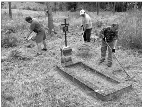
Úprava okolí pomníku ev. č. 52 dne 23. 7. 2016