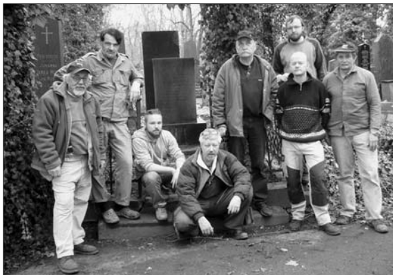
Praha Olšany – účastníci brigády 25. 3. 2016