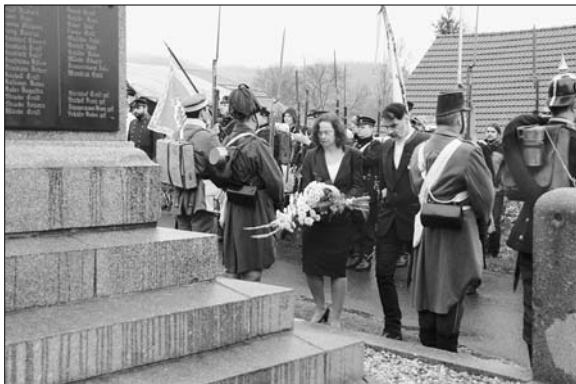
Pietní akt v Dlouhém Mostě 16. 4. 2016

V sobotu 16. dubna proběhla v Dlouhém Mostě první z plánovaných akcí, připomínajících veřejnosti historické události v době prusko-rakouské války roku 1866. Na samém začátku se shromáždili všichni uniformovaní účastníci před obecním úřadem, odkud průvod došel k centrálnímu pomníku před farou, kde proběhl pietní akt. Poté následoval přesun na místní hřiště, kde návštěvníci zhlédli volně pojatou bitevní ukázkou. Dekorová-