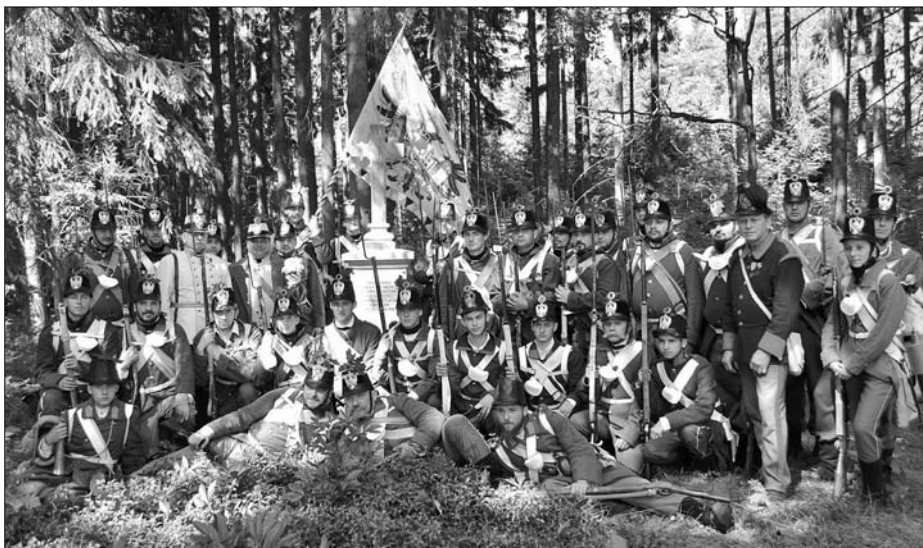
Příslušníci KVH-Ostrava u zrenovovaného Wimpffenova kříže