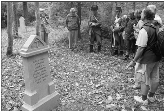
Komentované prohlídky v lese Dubno 28. 6. 2016

28. června se uskutečnila hlavní vzpomínková akce ve výroční den bitvy, které v letošním roce vyšlo na úterý. Program byl pořádaný městem ve spolupráci s členy praporu polních