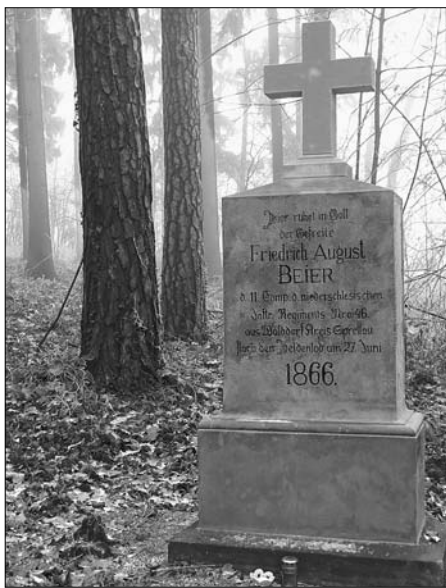
Památka ev. č. 80 po celkové renovaci