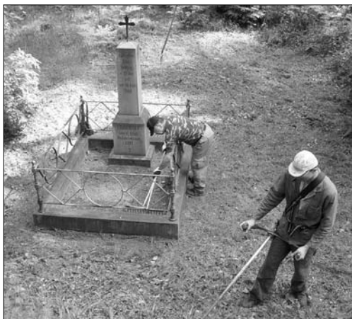
Brigáda v Kuřívodách 28. 5. 2016

Část soboty 23. července byla částečně naplněna sekáním trávy na bojišti u Kuřívod a Mnichova Hradiště. Ovšem hlavní úkol spočíval v prvním natření dřevěného plotu u pomníku ev. č. 1. Další brigáda stejného zaměření v obou uvedených lokalitách, včetně druhého nátěru ohraničení ševčínského pomníku, byla uskutečněna 3. září.