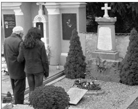
Křenov – zamýšlení nad právě vysvěcenou památkou

Po takřka šestiletém úsilí byl opraven náhrobek nad hrobem