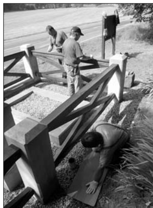
Nátěr plotu v Ševčíně 3. 9. 2016

V rámci Dnů evropského kulturního dědictví byly v sobotu 10. září v Seveřeském muzeu v Liberci pro návštěvníky připraveny komentované prohlídky výstavy Prusko-rakouská válka 1866, které po celý den zajišťovali členové Komitétu 1866 a Spolku vojenské historie Liberec o. s.