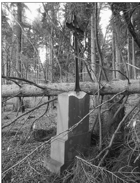
Památka ev. č. 80 po pádu stromu

ve formě daru od Klubu vojenské historie Ostrava ( www.kvh-ostrava.cz ) zabývajícího se historií a výstrojí rakouského 20. pěšího pluku z období napoleonských válek. Členové klubu zrenovovaný pomník i osobně navštívili u příležitosti účasti na výroční akci v Hradci Králové dne 2. července. Na pietním místě bylo vzpomenu na příslušníky rakouského 20. pěšího pluku, kteří v těchto místech hrdinně bojovali a mimo jiné utržili z rakouských jednotek během bitvy největší ztráty. Zazněly citace z plukovní kroniky i čestná salva.