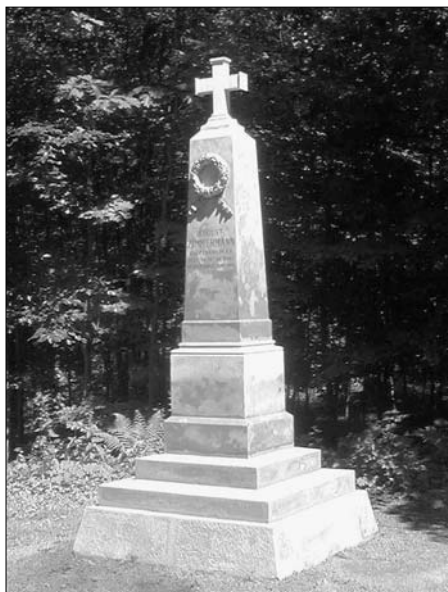
Restaurování pomníku setníka Zimmermanna ev. č. 45

jistou nejmenovanou úřednicí v 90. letech 20. stol. V listopadu pak Kamenictví Středa zajistilo přeskládání kamenné opěrné zdi. Současně zde Lesy a parky provedly obnovu zábradlí, zpevnění svahu a přístupové cestičky, což spolu s rozsáhlejšími úpravami terénu v okolí, které proběhly již v předchozím roce, přineslo výraznou proměnu celého prostoru k lepšímu.