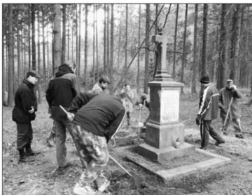
Členové Komitétu 1866 a SPVH-Náchod u památky ev. č. 84 během jarní brigády

Hlavní náplní dne bylo za přítomnosti restaurátorky P. Szabové vyzvednutí a narovnání obrubníků u tzv. Wipffenova kříže (ev. č. 84) v severovýchodní části Václavického lesa společně s úpravou okolního terénu. Památka byla následně koncem června celkově renovována. Finančně byl celý zásah zajištěn příspěvkem