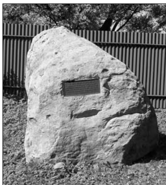
Restaurovaný balvan na hřbitově v Trutnově ev. č. 8

Dalším opravovaným byl pomník majora Liposčaka ev. č. 18 na severním svahu Janského kopce. V jeho případě se jednalo o celkové omytí od biologické zátěže, přetmelení erodovaných ploch, obnovení nápisů a navrácení podle fotografií celkem věrné repliky kovaného oplůtku, nesmyslně zlikvidovaného