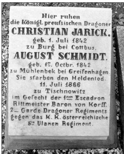
Restaurovaný náhrobek v Tišnově 5. 11. 2016