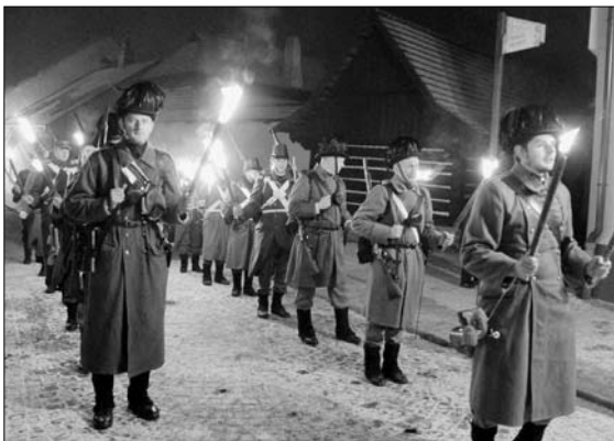
Pochodňový průvod na náměstí v České Skalici 1. 1. 2016

13. května jsem se zúčastnil archeologického průzkumu v prostoru ATC Rozkoš v místě, kde byla územním plánem města schválena výstavba biotopových jezírek. S archeology z náchodského muzea jsme se pokoušeli zachytit případné neoznačené hroby padlých. Na základě výsledků geofyzikálního měření bylo zjištěno, že prostor je značně kontaminován různými feromagnetickými předměty, což mohou být pozůstatky války 1866 anebo bezcenný materiál z období provozu kempu. Další průzkum bude proveden po odebrání ornice v roce 2017, kdy bude zahájena realizace stavby.