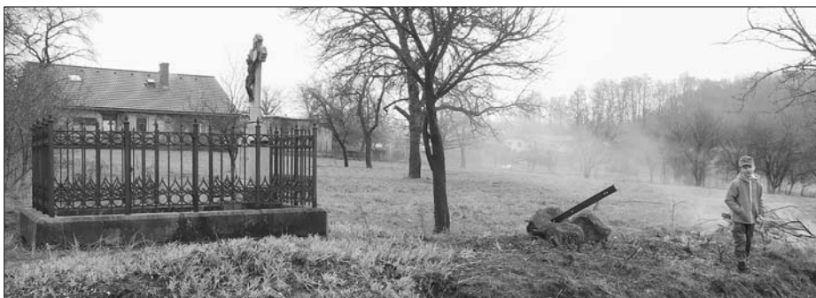
Brigáda v Horním Přímu 26. 3. 2016