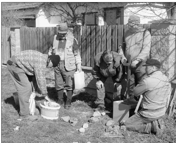
Označení pruského hrobu křížem v Holíně 2. 4. 2016