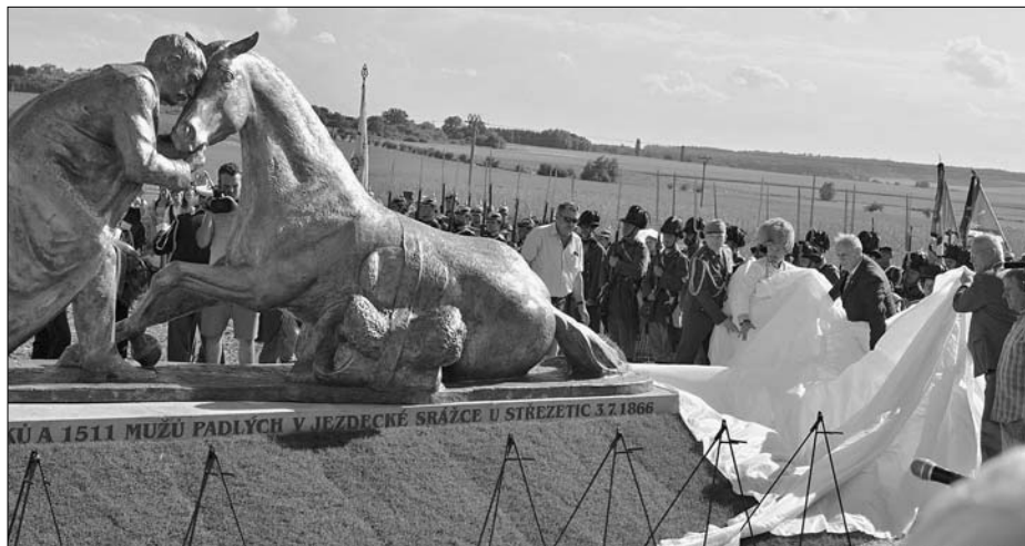
Odhalení pomníku jezdecké srážky u Střezetíc 1. 7. 2016

a poválečná situace v nově vznikající Československé republice již nedovolily záměr uskutečnit a do té doby získané finanční prostředky byly věnovány na opravy stávajících památek. V roce 2009 zahájil Komitét 1866 první kroky k realizaci oné ušlechtilé myšlenky z roku 1913 a v roce 150. výročí prusko-rakouské války roku 1866 se celé dílo podařilo dokončit.