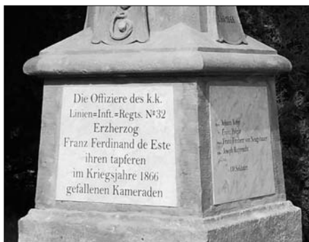
Detail nových nápisových desek (ev. č. 52)

Skvělá spolupráce s informačním centrem v České Skalici umožnila rozšířit sortiment nabízených předmětů s tematikou války 1866 o dvě nové pohlednice, turistickou známku, rozkládačku a limitovanou výroční hořkou čokoládu. Tyto materiály je možné získat v IC.