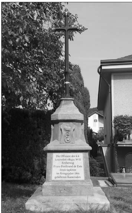
Pomník rakouského pěšího pluku č. 32 (ev. č. 52) v Malé Skalici po opravě

Návratu do původního stavu se dočkal pomník ev. č. 52 v Malé Skalici. Zásadním přínosem bylo obnovení mramorových desek s nápisy v němčině. Ačkoliv deskám není co vytknout, způsob a kvalita opravy samotného pomníku, prováděná P. Tomášem, je sporná.