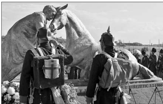
Kladení věnců k novému pomníku u Střezetic 1. 7. 2016

Jsem upřímně velice rád, že se dílo, započaté v roce 1913 zdařilo. Přeji mu dlouhého trvání bez újmy, nechtě se stane vyhledávaným místem návštěvníků bojiště z roku 1866 u Hradce Králové a jedním ze symbolů fenoménu 1866.