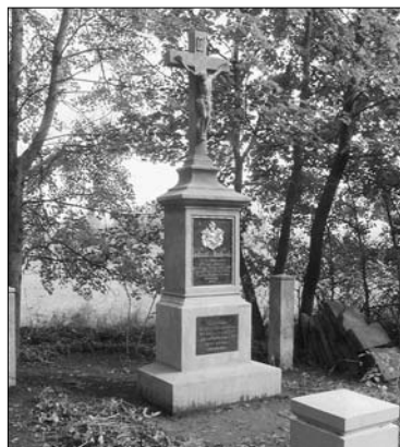
Restaurování pomníku F. Bassewitzze ev. č. 62

k původním německým nápisům, které byly nyní zhotoveny podle šablony, vytvořené z fotodokumentace pomníku z období před 2. sv. válkou, a práci korunovalo osazení nově vymodelovaného šlechtického erbu. Ten ve spolupráci s restaurátorem Kotrbáčkem, který ho podle dostupných fotografií předmodeloval, zhotovila osvědčená slévárna HVH v Horní Kalné a nechala pozlatit. V prosinci, ještě před napadáním sněhu, se podařilo firmě Lesy a parky Trutnov udělat terénní úpravy a vykácet náletovou zeleň. Už ve sněhu a mrazu konce roku namontovalo Kovářství Postrach repliku plotových polí a branky. I když prostředí u hlavní silnice není vzhledově ideální, je pomník po obnově výrazně důstojnější a honosnější a jistě i nepřehlédnutelný.